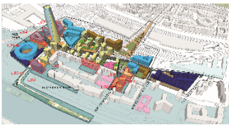
Structuration urbaine et architecturale pour atteindre la résilience centennale du futur quartier Charenton-Bercy